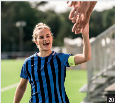
NOUVEAU WOMEN'S STRIPED DIVISION III