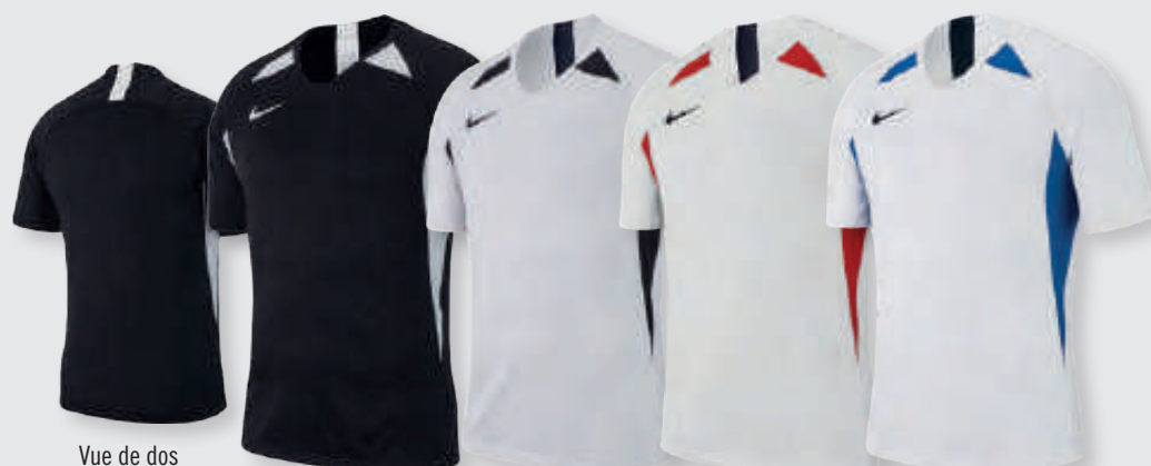
Vue de dos