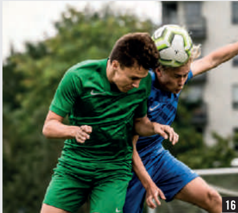
NOUVEAU CHALLENGE III