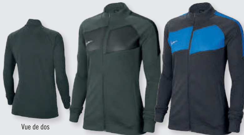
Vue de dos

Coupe standard pour une tenue décontractée