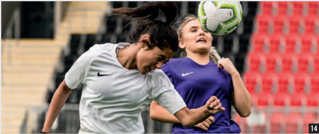
NOUVEAU WOMEN'S STRIKE