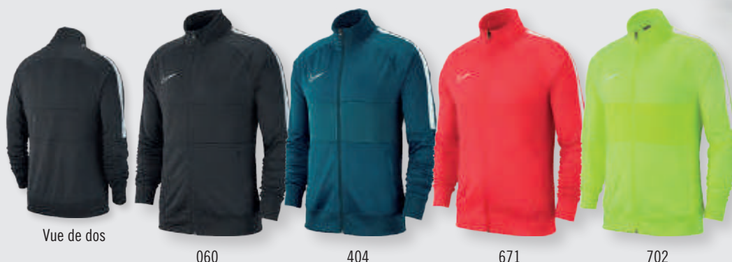
Vue de dos