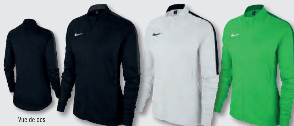
Vue de dos