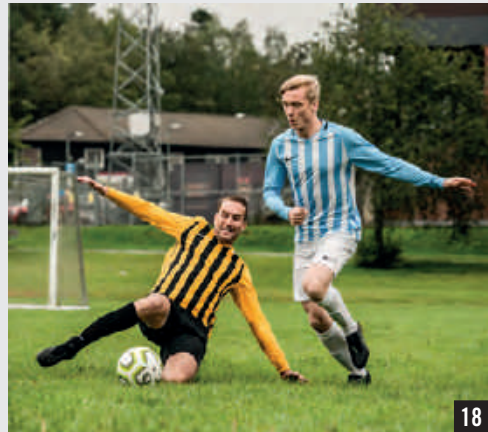
STRIPED DIVISION III