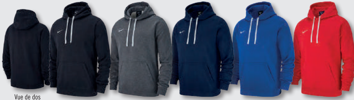
Vue de dos