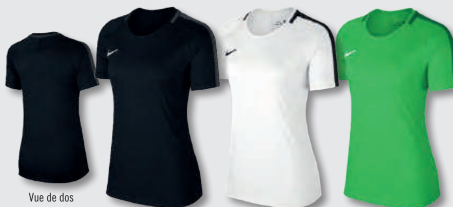
Vue de dos