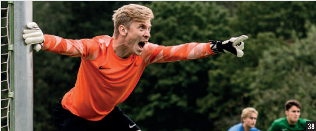
NOUVEAU GARDIEN III